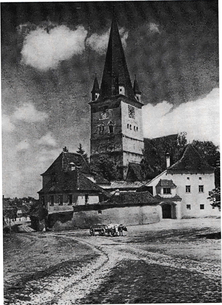
Biserica fortificată din Cisnădie