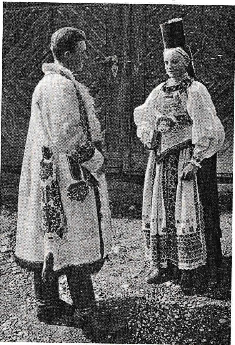
Tânăra familie de sași în port tradițional. Fotografie realizată de Kurt Hielscher în anul 1940 (fotografie păstrată în colecția Muzeului Național de Istorie a României, cu numărul de inventar 162104/238/b)

dintre cele două structuri, rigorile vieții de cazarmă și sacrificiile conflictului modern aveau să le cunoască după sosirea lor în garnizoanele Reich-ului German și pe fronturile unde aveau să fie trimiși în prima linie.